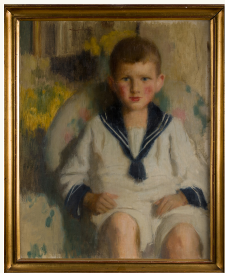
Alfons Karpiński Chłopiec w marynarskim ubranku olej na płótnie

W ramach działania Galerii Malarstwa Alfonsa Karpińskiego uruchomiona została Szkoła Malarstwa i Rysunku. To pierwsza w regionie pracownia artystyczna, która w kompleksowym wymiarze uczy sztuk plastycznych. Zajęcia skierowane są do odbiorców we wszystkich grupach wiekowych i o różnym stopniu zaawansowania – zarówno młodych adeptów sztuki chcących przygotować się do egzaminu na uczelnie artystyczne, jak też do hobbystów i pasjonatów, którzy w ten sposób będą rozwijali swoje zainteresowania. Znajdzie się tu miejsce dla dzieci w różnym wieku, a także miłośników rękodziela artystycznego.