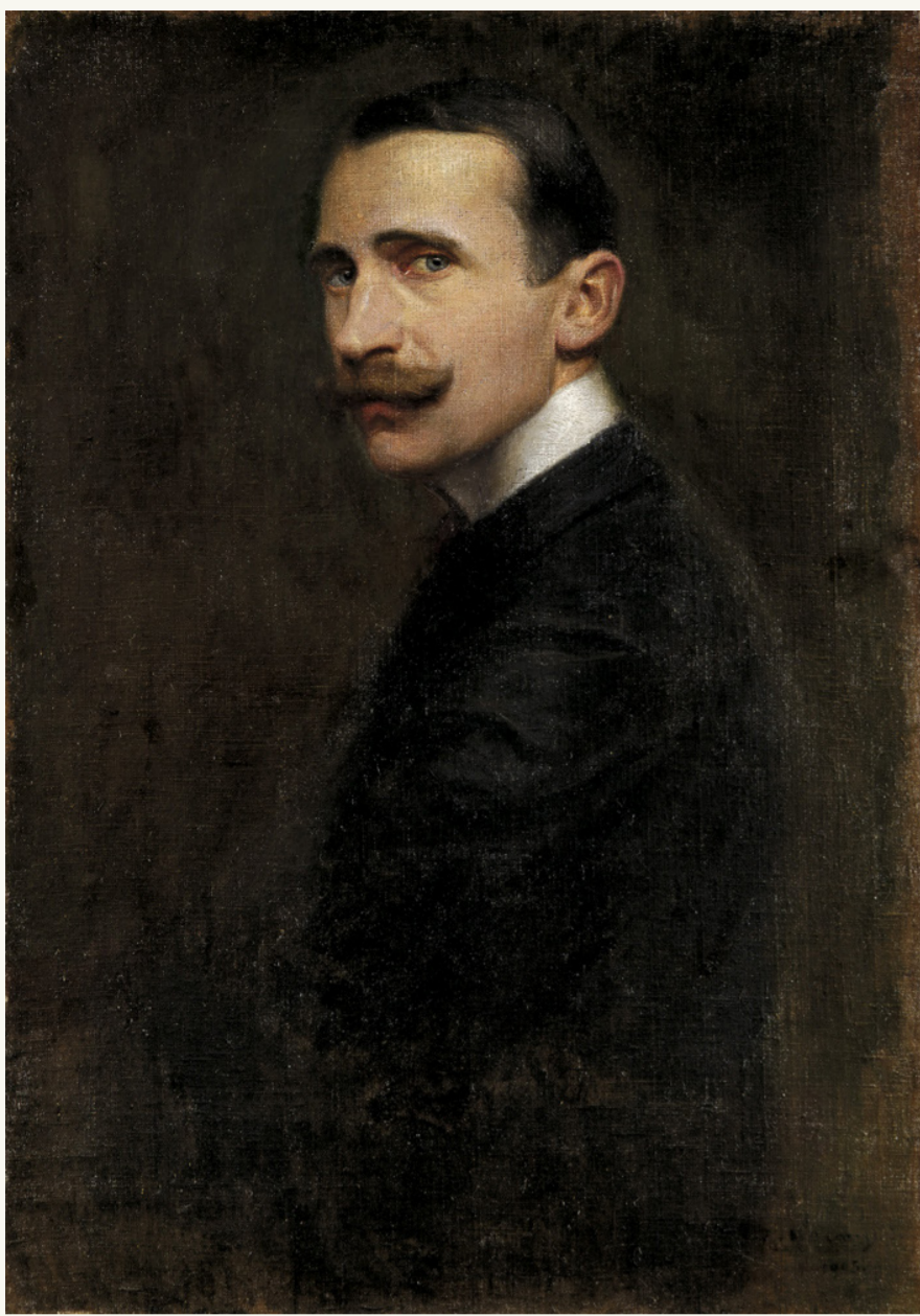
Alfons Karpiński Autoportret, 1905 olej na płótnie

Pierwsza w kraju galeria malarstwa Alfonsa Karpińskiego, jednego z czołowych twórców okresu Młodej Polski. Specjalizował się w portretach kobiecych, malował pejzaże. Nie jest to jednak wystawa „ku pamięci”, ale miejsce, które w nowoczesny sposób prezentuje jedną z najlepszych kolekcji poświęconych temu twórcy. Galeria połączona została z pracownią artystyczną, gdzie każdy będzie mógł doświadczyć procesu tworzenia, rozwijając kreatywność, dosłownie poczuć sztukę i stać się artystą. Alfons Karpiński przyszedł na świat właśnie w Rozwadowie (dzisiaj osiedle Stalowej Woli) i spędził tam pierwsze lata życia. Galeria Malarstwa Alfonsa Karpińskiego mieści się w zabytkowym budynku dawnego sądu. Ten okazały gmach został wzniesiony w 1905 roku z inicjatywy władz austriackiego zaborcy. W okresie II wojny światowej prowadzono w nim punkt opatrunkowy PCK, a następnie szpital polowy. Sąd znajdował się tu do roku 2012. Wówczas obiekt został oddany w opiekę stalowowolskiemu Muzeum Regionalnemu.