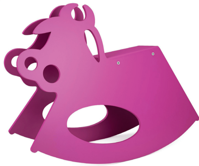
IWONA KOSICKA www.kosicka.pl