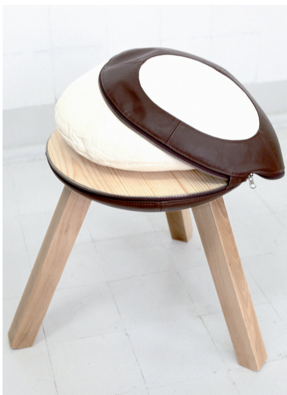
STOLEK KASZTAN CHESNUT STOOL