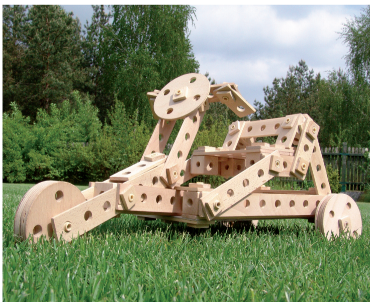
ZIEMOWIT KALIN www.eccolo.pl