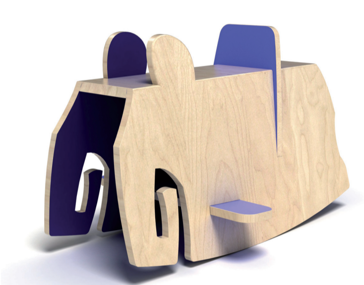
ŁUKASZ WYSOCZYŃSKI www.wysoczyński.com

Modernism and decorative character of art déco are present in the town's architecture and its urban development and also in the resources of the Museum such as the collection of applied art. The Museum has organized a series of design exhibitions: UNPOLISHED, POLSKA FOLK, DZIECINADA, JUST A THING – staged in London, Copenhagen, Berlin, Paris, Milan, Köln and Venice.