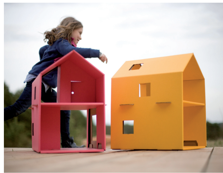
TRZY MYSZY Farida Dubiel, Krzysztof Dubiel www.trzymyszy.pl