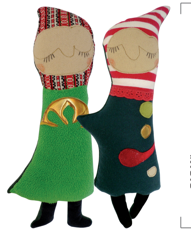
LALKI GAGANI GAGANI DOLLS