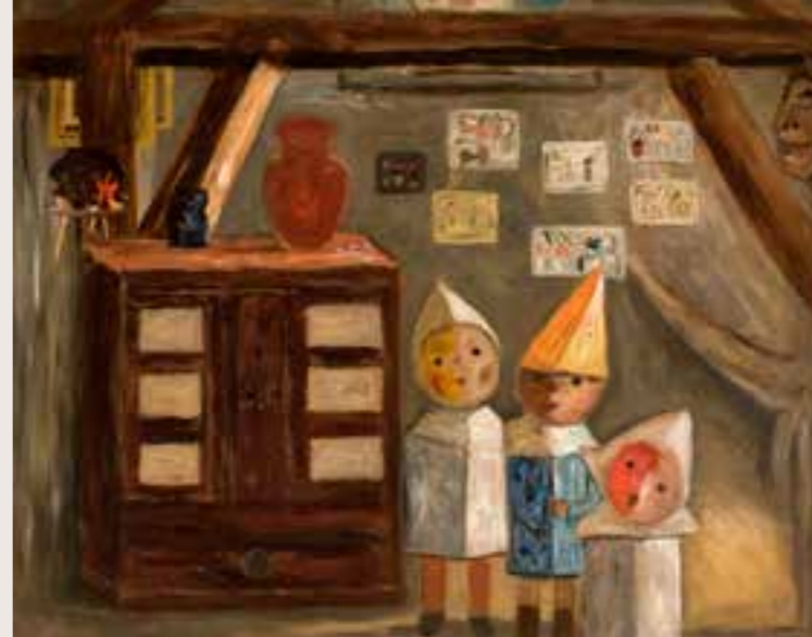
W pracowni, ok. 1923, olej na płótnie; 45,5 × 55 Muzeum Narodowe w Krakowie, nr inw. II-b-953