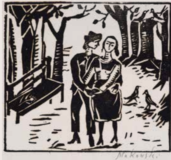
Tadeusz Makowski, Para zakochanych drzeworyt na papierze; 18,7 × 27,5 Muzeum im. Stanisława Fischera w Bochni, nr inw. MB-AH/434

Wystawa w Muzeum Regionalnym w Stalowej Woli 4 marca – 15 kwietnia 2018