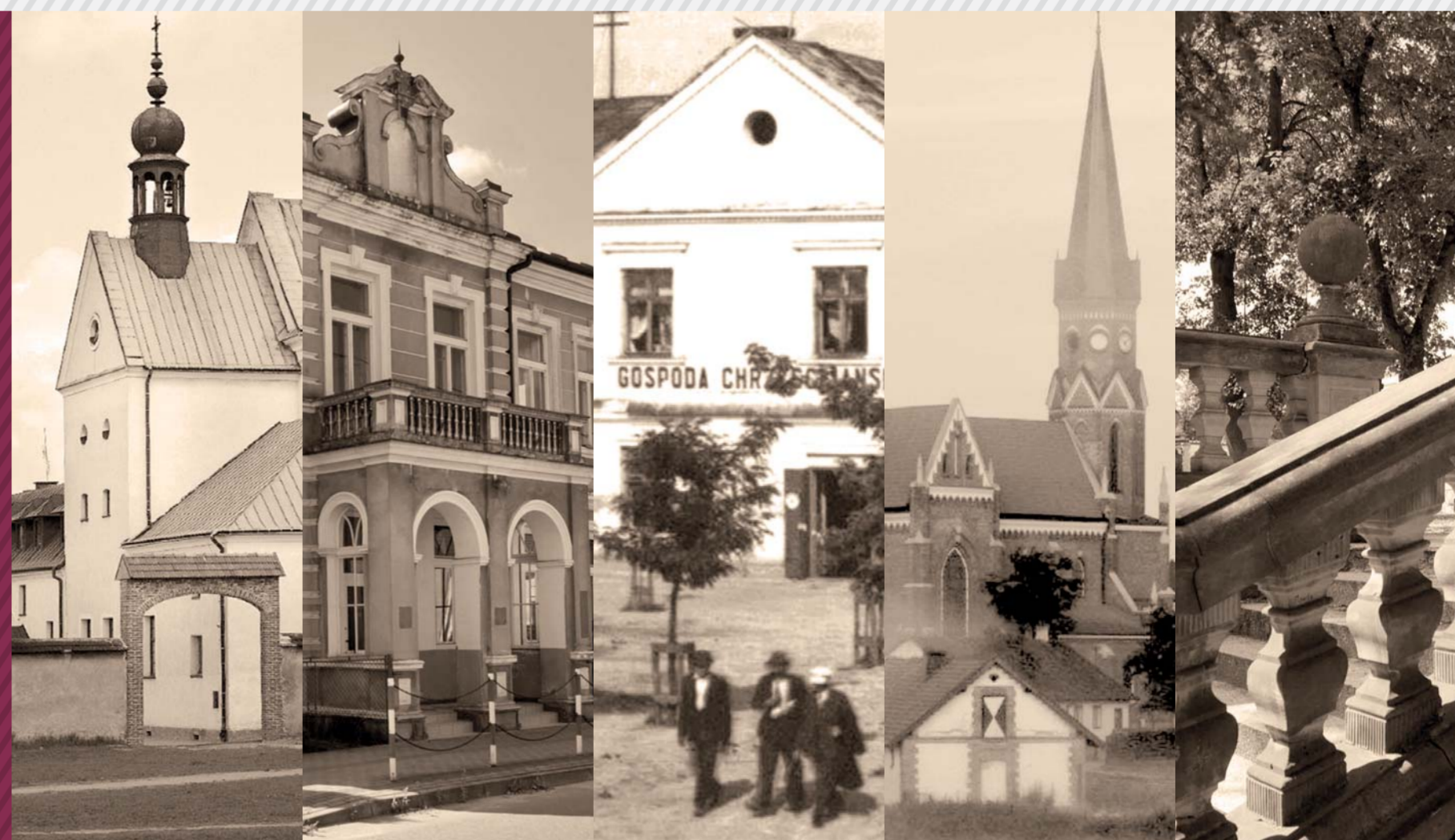
Stała oferta edukacyjna

POZNAJ najstarsze dzielnice Stalowej Woli ROZWADOW I CHARZEWICE