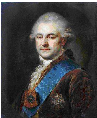
Stanisław August Poniatowski – ostatni król Polski

Konstytucja nie wzięła się znikąd. Stworzyli ją najświetlejsi obywatele Rzeczypospolitej Obojga Narodów, potrafiący wznieść się ponad ideologiczne podziały i nie bacząc na światopoglądowe różnice, stworzyć dzieło w naszej historii wyjątkowe. Owi Ojcowie Konstytucji na naszą pamięć ze wszech miar zasługują. Przypomnijmy więc choćby tych najaktywniejszych.